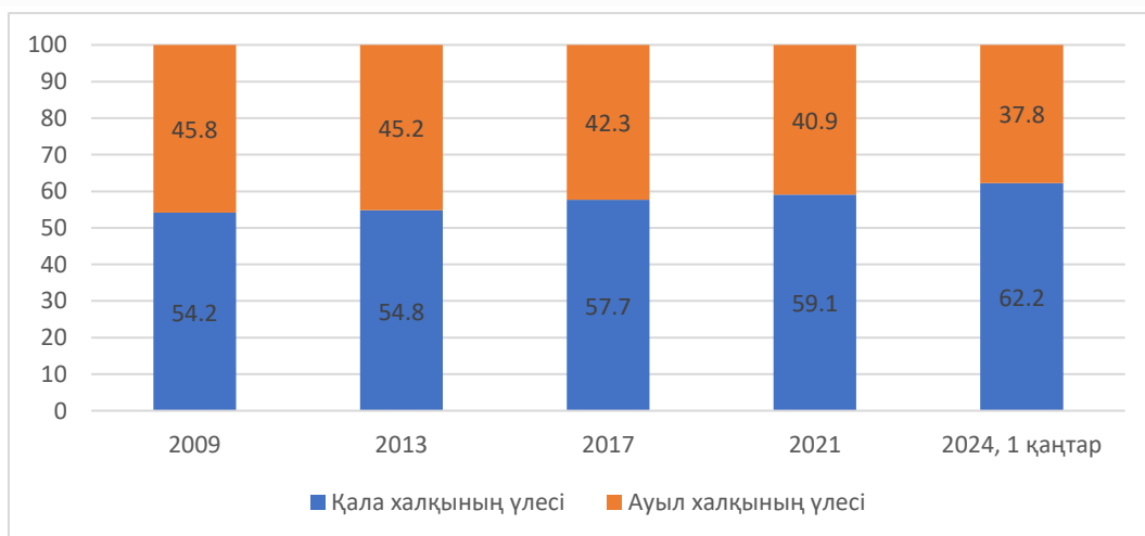
Сурет 2. Қала және ауыл халқы үлесінің өзгеруі [4].

Қала халқы тек 2010-жылдарға қарай тұрақты өсе бастағанын төменгі суреттен көрсек болады. Осы ретте Қазақстандық урбанизацияның ерекшеліктеріне назар аударсақ.